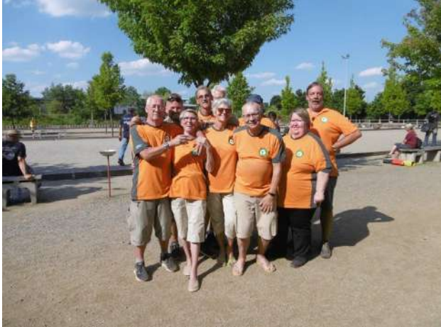
(Zweite Mannschaft bei der Siegerehrung. 2. Platz in der Kreisliga)

Anfang Mai fand auf dem Gelände des TV Brühl Samstags die Landesmeisterschaft und Sonntags die Qualifikation zur Deutschen Meisterschaft im Doublette statt. Da es leider für diese Veranstaltung keinen Ausrichter gab, übernahmen wir kurzfristig dieses Event.