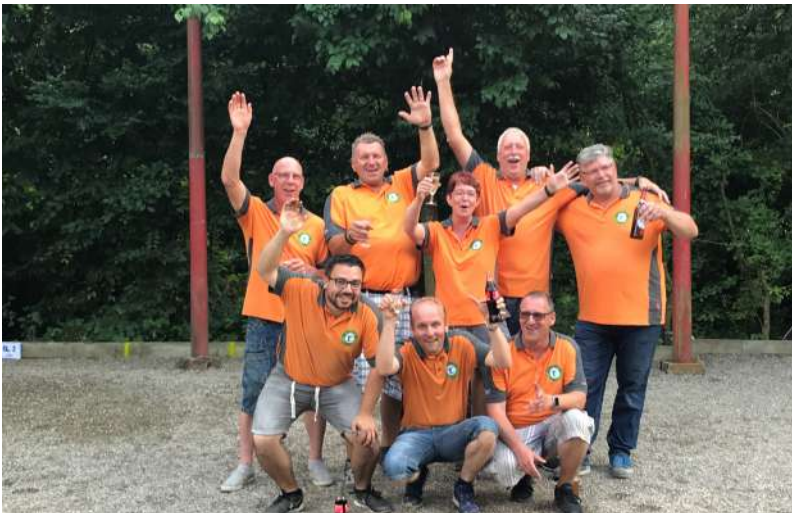
(Erste Mannschaft nach dem 3. Spieltag)

Auch für unsere erste Mannschaft hieß es an diesem Samstag „Dreierspieltag“. Mit etwas gemischten Gefühlen, hatten sie doch in der letzten Saison am Dreierspieltag alle Spiele verloren und damit den Aufstieg verpasst, ging es zu den Boulefreunden nach Neckargerach. Dieses Mal wurden 2 Partien gewonnen. Aktuell lagen sie damit in der Tabelle auf Platz vier.