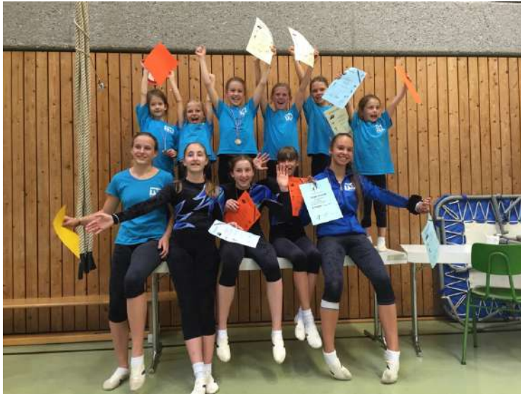
Teilnehmerinnen der Turngaudi