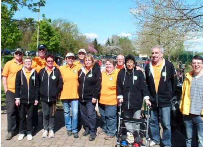
2.Mannschaft beim 1. Ligaspieltag

die leider mit 2:3 verloren ging. Aber der Siegeswillen war da und so begann die letzte Runde. Hier überließ die Mannschaft nichts mehr dem Zufall. Sie zeigten dem Gegner was sie über Winter gelernt hatten und konnten mit einem 4:1 Sieg den 2. Punkt einfahren.