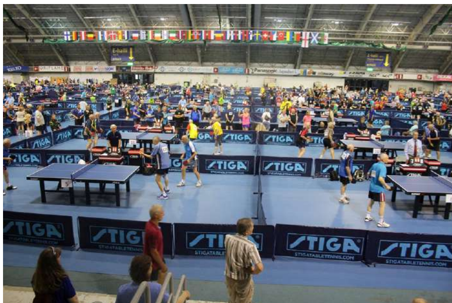
Imposanter Anblick der Halle in Tampere (Finnland), wo an 90 Tischen um die Senioren-Europameisterschaft gekämpft wurde

unterlag sie jeweils knapp im 5. Satz. Diese unglücklichen Niederlagen wirkten sich negativ auf die weiteren Spiele aus und verhinderten insbesondere im Doppel letztlich den möglichen Einzug ins Hauptfeld. In der Trostrunde zeigte sich Susi jedoch bis in die Haarspitzen motiviert. Vier Siege ebneten den Einzug ins Finale, im Halbfinale konnte sie dabei sogar einen 0:2 Rückstand wettmachen. Im Finale stand sie dann der Tschechin Gabriela Aubusova gegenüber. Auch in diesem Spiel lag sie bereits 2:0 nach Sätzen hinten und konnte sich aber noch hauchdünn 3:2 durchsetzen. In der Trostrunde des Doppels war im Viertelfinale leider Endstation. Alles in allem war der sportliche Auftritt eine fantastische Leistung unserer Spitzenspielerin der Damenmannschaft.