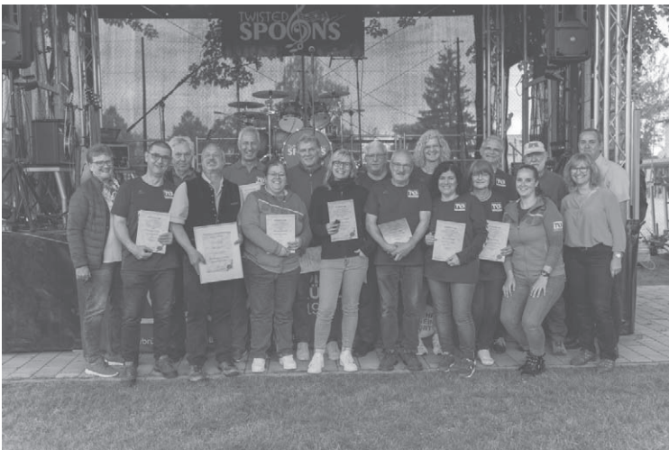
Die vom Hauptverein geehrten Mitglieder, welche über Jahre ehrenamtlich für die Handballabteilung tätig waren und sind