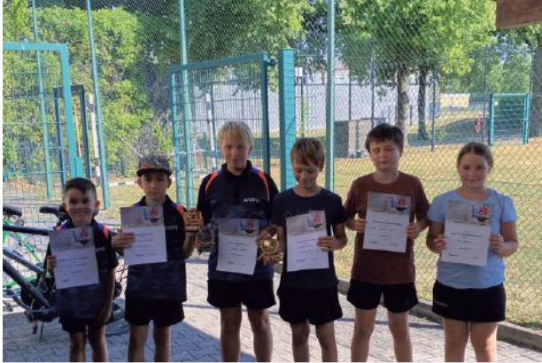
Die jungen Doppelsieger...

Die Meisterschaften fanden ihren Ausklang in gemütlicher und geselliger Runde. Jeder der Teilnehmer wünscht sich sicher eine Durchführung auch im nächsten Jahr.