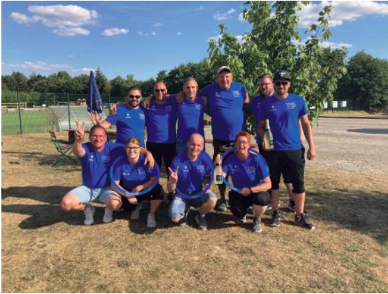
1. Mannschaft - Auf dem Bild fehlt Madeleine