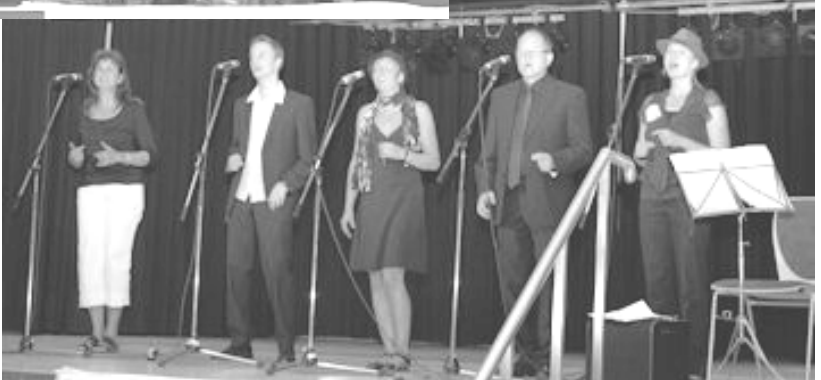
Fine Art Music